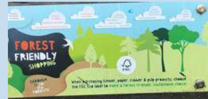
Вверху и внизу: Дополнительная экспозиция зоопарка Таронга информирует посетителей об утрате лесов и экосистем и о необходимости содействовать защите лесов посредством покупки продукции с фирменным знаком FSC.

Зоопарк Таронга использует всё более широкие возможности – например, применяя в строительстве своих новых инновационных объектов лесные продукты, произведенные на основе экологически устойчивых методов. В целях сокращения негативного воздействия строительных материалов на окружающую среду мы применяли в строительстве нашей новой экспозиции «Прибежище диких животных» (Wildlife Retreat) главным образом лесоматериалы, причём 100% всей этой древесины либо представляло собой