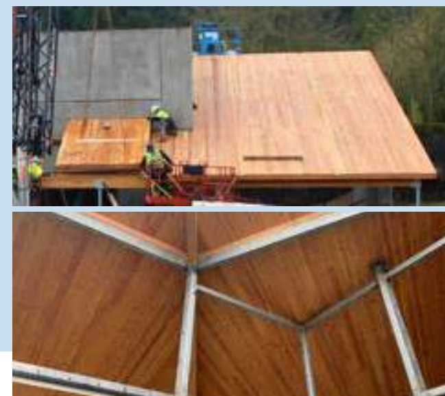
Вверху: CLT-панели в конструкции экспозиции приматов; зоопарк Орегона Внизу: CLT-панели в конструкции экспозиции белых медведей; зоопарк Орегона Справа: Счёт для зоопарка Оснабрюка со ссылкой на сертификацию FSC

Материал CLT-панелей представляет собой возобновляемый ресурс, добываемый на основе рационального использования лесов, а производство этих панелей не требует сжигания ископаемых видов топлива. При процессах добычи древесины и производства одной тонны пиломатериалов выделяется в семь раз меньше углекислого газа, чем при производстве одной тонны бетона. Сокращение выбросов углекислого газа в результате столь простого действия, как замена бетона или стали древесиной, может компенсировать многолетнее загрязнение атмосферы выбросами углерода в результате строительных работ.