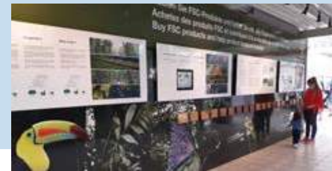
Одна из двух экспозиций, посвящённых рациональному использованию лесов, в зоопарке «Papiliorama Foundation» (Швейцария).