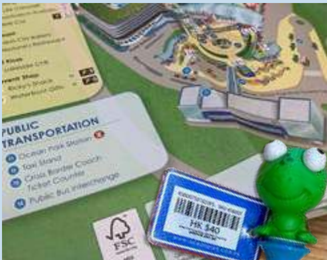
Парк океанов Гонконга применяет в своей повседневной деятельности (например, при изготовлении путеводителей и ценников) политику использования FSC-сертифицированной бумаги.

Парк океанов уже давно выступает за рациональное использование ресурсов, и мы осознаём важность выбора ответственных поставщиков бумаги, которую мы используем в нашей повседневной работе. Одно из направлений деятельности нашего тематического парка, в которой нам требуются наибольшие объёмы бумаги, – это издание путеводителей, и все наши путеводители напечатаны на бумаге, сертифицированной FSC. Кроме того, FSC-сертифицированная бумага используется в изготовлении ценников для широкого ассортимента предлагаемой нами сувенирной продукции, от плюшевых игрушек до футболок. Вся бумага для печати и конверты, которые мы используем в работе наших офисов, также сертифицированы по стандарту FSC.